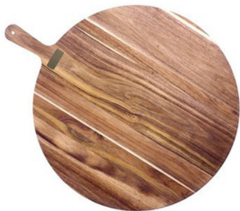
PLANCHE À DÉCOUPER