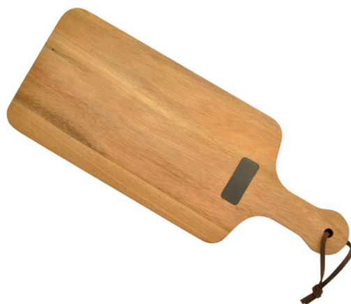
PLANCHE À DÉCOUPER